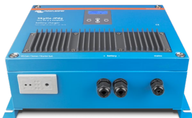
Skylla-IP65 12/70 (1+1)

Para saber mais sobre baterias e o seu carregamento, consulte o nosso livro Energy Unlimited (disponível gratuitamente na Victron Energy e descarregável em www.victronenergy.com ).