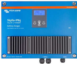
Skylla-IP65 12/70 (1+1)

12 V / 70 A e 24 V / 35 A, intervalo da tensão de entrada 90 V a 265 V