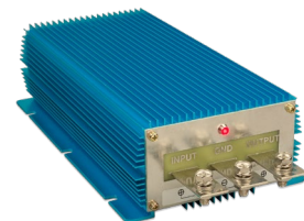
Orion IP67 24/12-100 Orion IP67 12/24-50