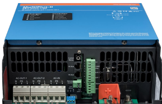
Área de Ligação