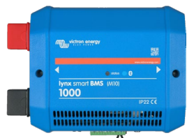
Lynx Smart BMS 1000A