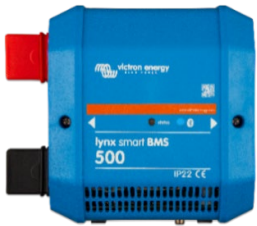
Lynx Smart BMS 500 A