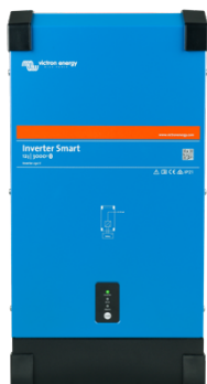
Inversor Smart 12/3000