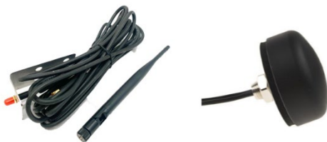
Antena exterior opcional LTE-M de montagem em parede (ANT100200100)