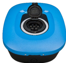
EV Charging Station NS - frente