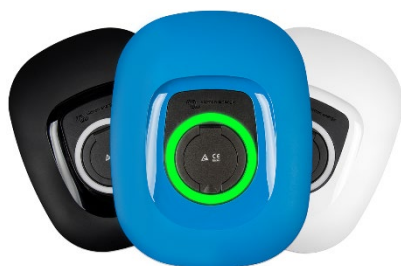
Frente negra, azul («standard») ou branca