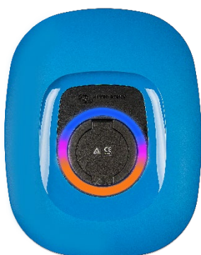
EV Charging Station NS