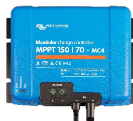
Controlador de Carga Solar MPPT 150/70-MC4