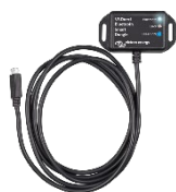
Dongle VE.Direct Bluetooth Smart.