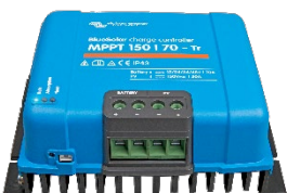
Controlador de Carga Solar MPPT 150/70-Tr