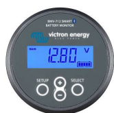
Deteção bluetooth : Monitor de Bateria BMW-712 Smart ou SmartShunt