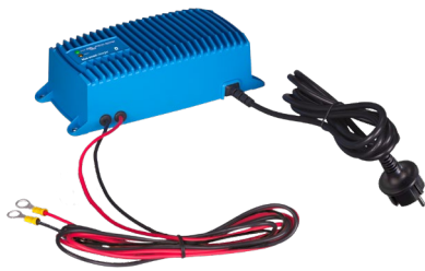
Carregador Blue Smart IP67 12/25