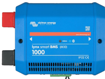
Lynx Smart BMS 1000 A