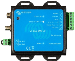
VE.Bus BMS V2