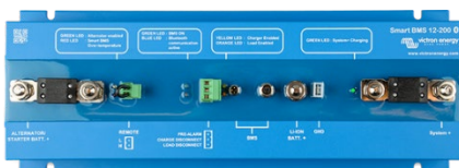
Smart BMS 12/200