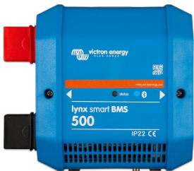
Lynx Smart BMS 500 A